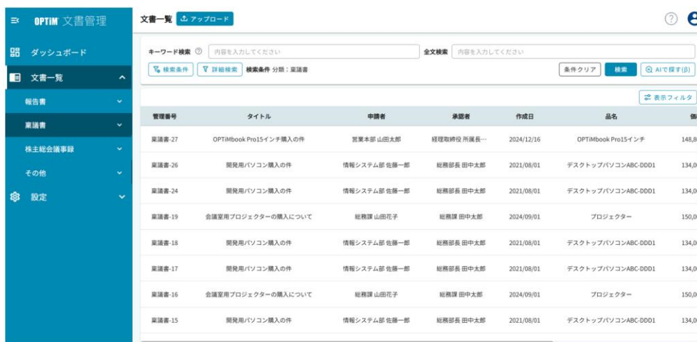
AIが分類別に文書の自動仕分けを行い、分類に合わせた管理台帳をAIで自動作成